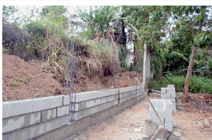
Muro do condomínio (DEPOIS)