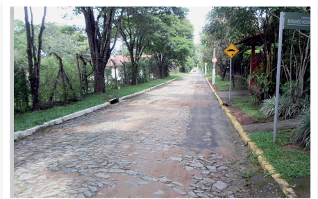
Alameda Dolomita (ANTES)