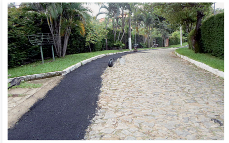
Pista de caminhada (DEPOIS)