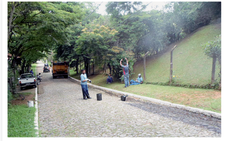
Pista de caminhada (ANTES)