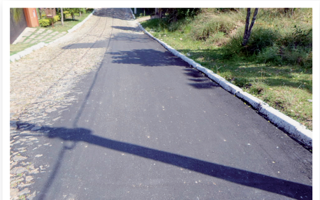
Alameda Dolomita (DEPOIS)