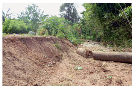
Muro do condomínio (ANTES)