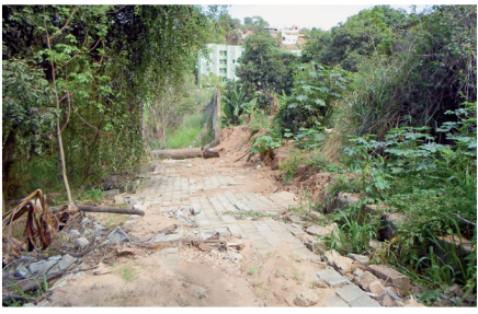
Muro do condomínio (ANTES)